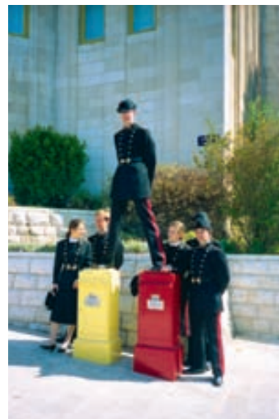
Boîtes aux lettres à Jérusalem.